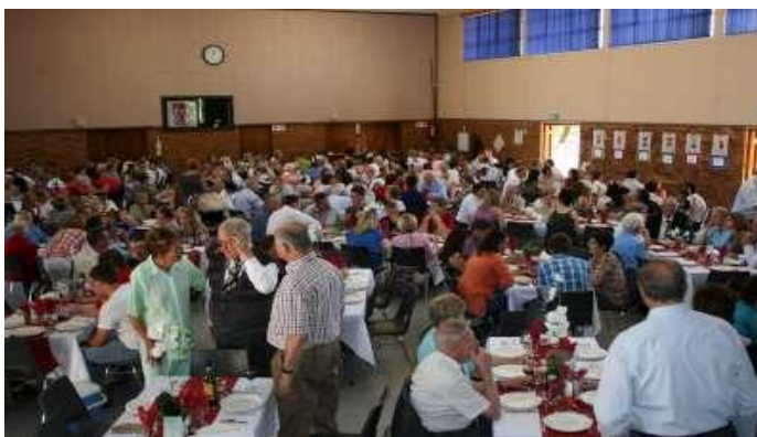
Die gaste in gesellige luim