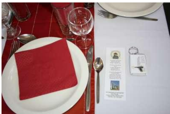
Die gedekte tafels