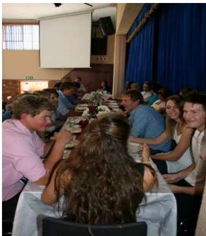
Die studente en jong klomp het sommer hulle eie tafel gereël en die dinee as groep geniet.