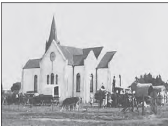
Gemeente gestig in 1896. Weens die oorlog is die kerkgebou in 1903 opgerig.

Die Gereformeerde Kerk Krugersdorp vier DV die naweek van 29-31 Mei 2026 die 130ste bestaansjaar van die gemeente. Daar word beplan om die aand van die 29ste Mei 'n musiekkonsert aan te bied. Saterdag 30 Mei word 'n fees-ete beplan en Sondag 31 Mei